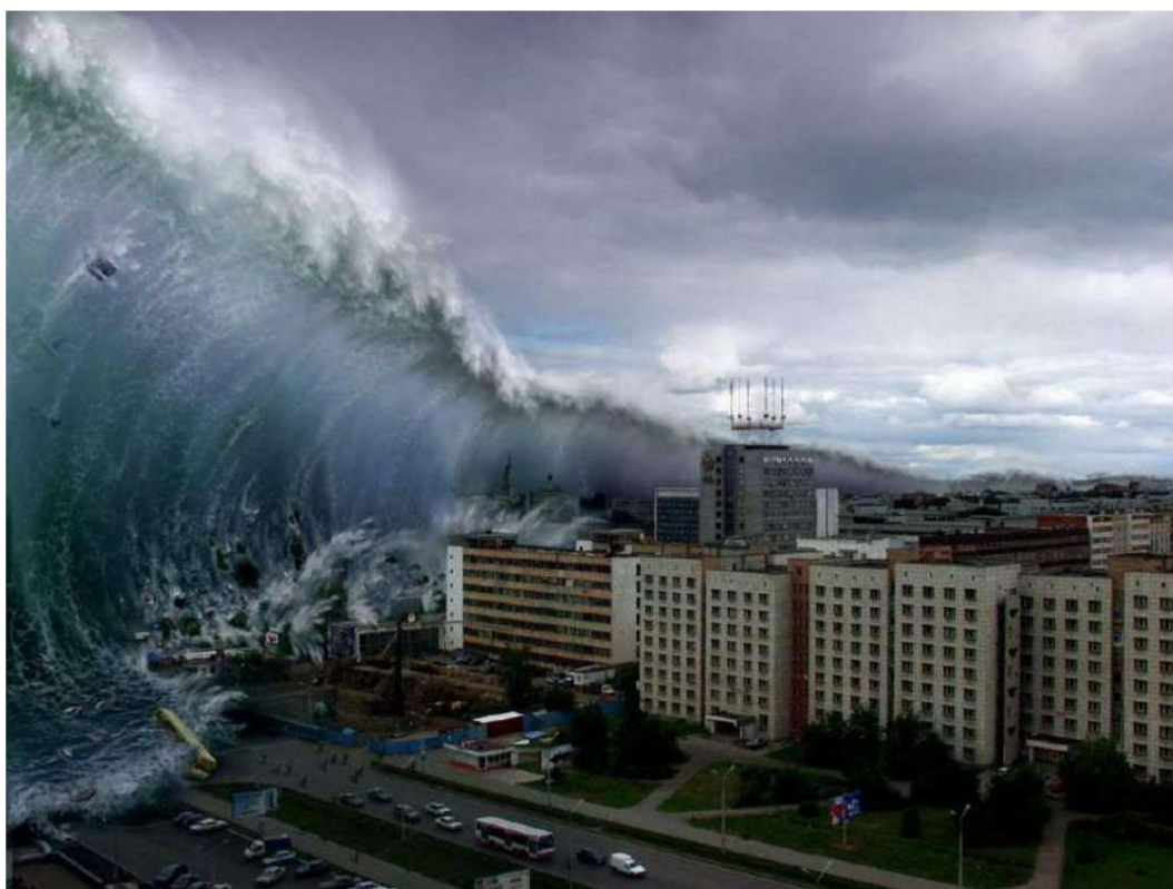
Hình - Sóng thần

Điều thu hút sự chú ý là sự trùng hợp giữa kết luận được các nhà khoa học đưa ra và báo cáo của John: "Và phần thứ ba của những sinh vật sống ở đó đã chết. trong biển" "và phần thứ ba của biển trở thành máu (máu - màu đỏ) . Các nghiên cứu khác cho thấy chuyển động của sóng sau khi va chạm. Sự rơi của tiểu hành tinh sẽ gây ra điều gì đó tương tự như những gì xảy ra khi chúng ta ném một hòn đá xuống hồ. Tại thời điểm nó rơi xuống, một làn sóng hình tròn được hình thành kéo dài và lan rộng cho đến khi chạm tới mép hồ. Điều tương tự sẽ xảy ra, ở quy mô lớn hơn nhiều. Theo dự đoán, tác động của một tiểu hành tinh có đường kính 10km ở giữa Đại Tây Dương sẽ tạo ra một làn sóng cao 5km tại điểm va chạm, lan truyền tới bờ biển nước Mỹ ở độ cao khoảng 500 mét. . , quét sạch mọi thứ trên đường đi của nó và tiến sâu vào lục địa tới 200km. Trận sóng thần lớn này, tức là làn sóng, sẽ nhấn chìm nhiều con tàu, đáp ứng tầm nhìn của John: "và một phần ba số tàu đã bị phá hủy".