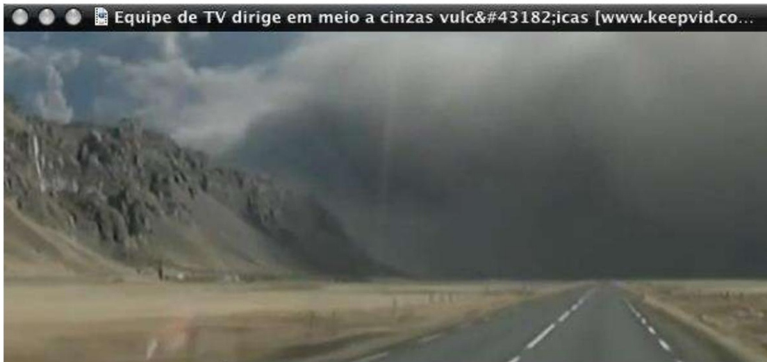
Hình 1 - khói từ vụ phun trào của núi lửa Iceland lan khắp đường chân trời.

nhiệt độ cao, nó sẽ có xu hướng thoát ra ngoài qua các "lỗ" trên trái đất. Hành tinh của chúng ta thực sự có rất nhiều "lỗ", gọi là núi lửa - những lỗ mà dung nham nóng chảy chảy ra với áp suất cao. Sau cú va chạm của sao chổi, áp lực do "cú đấm" nó tạo ra lên bề mặt trái đất sẽ được giảm bớt do sự bùng nổ của nhiều núi lửa. Mỗi người trong số họ sẽ ném hàng ngàn tấn kim loại nóng chảy, lưu huỳnh, chất thải độc hại và khói đen lên bầu trời, làm mặt trời và không khí tối đen. Kết quả sẽ tương tự như kết quả được thấy sau vụ phun trào chỉ một ngọn núi lửa ở Iceland vào tháng 10 năm 2010 - nơi gần một nửa số chuyến bay ở châu Âu đã bị hủy. Gần núi lửa, bạn không thể nhìn thấy bầu trời vì khói đã đen kịt mọi thứ.