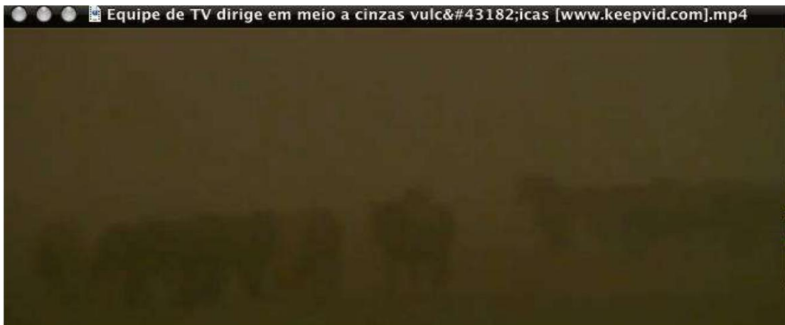
Hình 3 - Ảnh chụp vào ban ngày - tầm nhìn bị suy giảm do khói từ núi lửa - nguồn: BBC Brasil Video.

Từ những hình ảnh trên, chúng ta có thể hình dung được văn bản Kinh thánh sẽ được ứng nghiệm như thế nào. Mặc dù phiên bản Kinh thánh của chúng ta giúp chúng ta hiểu rằng các ngôi sao sẽ không chiếu sáng trong phần thứ ba của ngày và đêm, nhưng các phiên bản khác cho chúng ta hiểu rằng trên thực tế, phần thứ ba của trái đất sẽ bị tấn công. bởi bóng tối, nhưng không phải các vì sao. Khi đó các tầng trời sẽ tối đen và độ sáng của các ngôi sao sẽ mờ đi. Sách Khải Huyền bình luận về ảnh hưởng của bóng tối do khói gây ra trên trái đất - các ngôi sao sẽ không được nhìn thấy. Chẳng hạn, Kinh thánh Jerusalem cho chúng ta biết đoạn văn: "Phần thứ ba của chúng (của các ngôi sao) đã mờ đi; ngày mất một phần ba ánh sáng, đêm cũng vậy" (Khải Huyền 8:12). Vì vậy, chúng tôi hiểu rằng lời tiên tri này có thể được ứng nghiệm theo cách sau: một phần ba trái đất sẽ có bầu trời bị đen kịt bởi khói núi lửa. Bạn không cần phải là nhà khoa học mới có thể dự đoán được hậu quả. Không có ánh sáng cây không thể phát triển. Do đó, toàn bộ mùa màng sẽ bị mất, làm trầm trọng thêm vấn đề nạn đói sẽ xảy ra sau khi tiếng kèn đầu tiên vang lên. Lời của Chúa Giêsu sẽ được ứng nghiệm theo nghĩa đen: "Sẽ có nạn đói, dịch lệ và động đất ở nhiều nơi" (Mt 24:7).