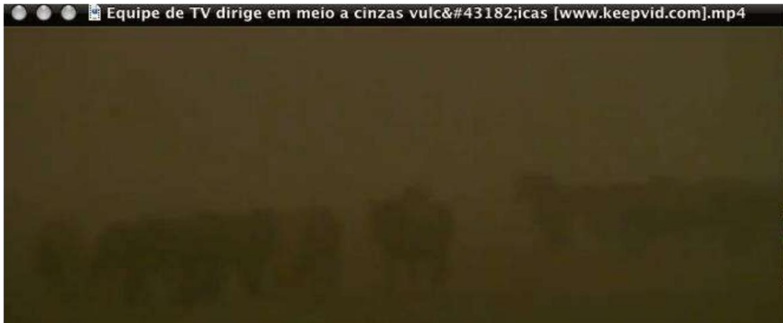
이미지 3 – 낮에 촬영한 이미지 – 화산 연기로 인해 가시성이 저하됨

위의 이미지에서 우리는 성경 본문이 어떻게 성취될 것인지에 대한 아이디어를 얻었습니다. 우리 성서 번역판에서는 낮과 밤의 삼분의 일 동안에는 별들이 빛나지 않을 것이라고 이해하고 있지만, 다른 번역판에서는 땅의 삼분의 일이 실제로 충돌할 것이라고 이해하고 있습니다. 어둠이 아니라 별이 아닙니다. 그러면 하늘이 어두워지고 별들의 빛이 어두워질 것이다. 묵시록에서는 연기로 인한 어둠이 지구에 미치는 영향에 대해 설명합니다. 별은 보이지 않을 것입니다. 예를 들어, 예루살렘 성서에는 다음과 같은 내용이 나와 있습니다. “그들 (별들의) 삼분의 일이 어두워졌습니다. 낮과 밤이 그 빛의 삼분의 일을 잃었느니라” (계 8:12). 그러므로 우리는 이 예언이 다음과 같은 방법으로 성취될 수 있음을 이해합니다. 즉, 땅의 3분의 1이 화산 연기로 하늘이 어두워질 것입니다. 결과를 예측하기 위해 과학자가 될 필요는 없습니다. 빛이 없으면 식물은 자랄 수 없습니다. 그리하여 수확물 전체가 손실될 것이며, 첫 번째 나팔이 성취된 후에 발생할 기아 문제는 더욱 악화될 것입니다. “처처에 기근과 역병과 지진이 있으리니” (마 24:7) 라는 예수님의 말씀이 문자 그대로 성취될 것입니다.