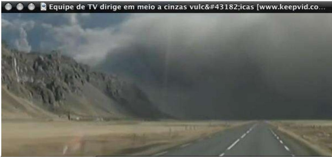
চিত্র 1 - দিগন্ত জুড়ে ছড়িয়ে পড়া আইসল্যান্ডীয় আগ্নেয়গিরির অগ্ন্যুৎপাত থেকে ধোঁয়া।

তাপমাত্রা, এটি পৃথিবীর "গর্ত" মাধ্যমে বেরিয়ে আসতে থাকে। আমাদের গ্রহে আসলে অনেকগুলি "গর্ত" রয়েছে, যাকে আগ্নেয়গিরি বলা হয় - গর্ত যার মধ্য দিয়ে গলিত লাভা উচ্চ চাপে বেরিয়ে আসে। ধূমকেতুর প্রভাবের পরে, এটি পৃথিবীর পৃষ্ঠে "পাঞ্চ" দিয়ে যে চাপ তৈরি করবে তা অনেক আগ্নেয়গিরির বিস্ফোরণের মাধ্যমে উপশম হবে। তাদের প্রত্যেকেই হাজার হাজার টন গলিত ধাতু, সালফার, বিষাক্ত বর্জ্য এবং কালো ধোঁয়া আকাশে নিক্ষেপ করবে, যা সূর্য ও বাতাসকে অন্ধকার করে। ফলাফল 2010 সালের অক্টোবরে আইসল্যান্ডে মাত্র একটি আগ্নেয়গিরির অগ্ন্যুৎপাতের পরে দেখাগুলির মতোই হবে - যেখানে ইউরোপের প্রায় অর্ধেক ফ্লাইট বাতিল করা হয়েছিল। আগ্নেয়গিরির কাছে আপনি আকাশ দেখতে পাচ্ছেন না, কারণ ধোঁয়া সবকিছু কালো করে দিয়েছে।