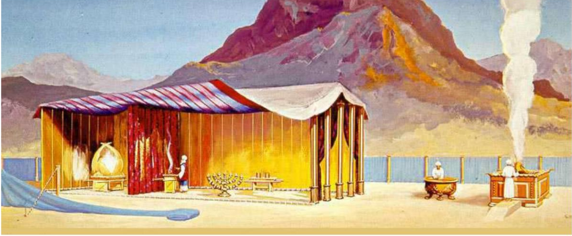
চিত্র - পবিত্র (ডানে, যেখানে পুরোহিত) এবং সবচেয়ে পবিত্র (বাম) স্থান

ঈশ্বর মূসাকে একটি অভয়ারণ্য নির্মাণের নির্দেশ দিয়েছিলেন এবং এর ভিতরে ধূপ জ্বালানোর জন্য একটি সোনার বেদি স্থাপন করেছিলেন। "তুমি ধূপ জ্বালানোর জন্য একটি বেদি তৈরি করবে... খাঁটি সোনা দিয়ে মুড়ে দেবে... এবং সাক্ষ্য-সিল্ডুকের কাছে থাকা ঘোমটার সামনে বেদীটিকে স্থাপন করবে" (প্রস্থান 30:1, 3, 6)। উভয়ই একটি প্রতীক ছিল, "স্বর্গীয় জিনিসের চিত্র এবং ছায়া, যেমন মোজেসকে ঐশ্বরিকভাবে সতর্ক করা হয়েছিল, যখন তিনি তাম্বু তৈরি করতে চলেছেন; কেননা তাঁহাকে বলা হইয়াছিল, দেখ, পর্বতে তোমাকে যে নমুনা দেখানো হইয়াছে, সেই অনুসারে কর" (ইব্রীয় ৮:৫)। হিব্রুদের অভয়ারণ্য ছিল স্বর্গীয় এক অনুলিপি। "কারণ খ্রীষ্ট হাত দিয়ে তৈরি করা একটি অভয়ারণ্যে প্রবেশ করেননি, সত্যের প্রতিকৃতি, কিন্তু স্বর্গে প্রবেশ করেন।" খ্রীষ্ট "মহারাজের সিংহাসনের ডানদিকে স্বর্গে উপবিষ্ট" এবং সেখানে "পবিত্র স্থান এবং সত্য তাঁবুর মন্ত্রী, যা প্রভু প্রতিষ্ঠা করেছিলেন, মানুষ নয়" (ইব্রীয় 9:24; 8:1), 2)। অভয়ারণ্যটি দুটি অংশে বিভক্ত ছিল, একটি ঘোমটা দ্বারা পৃথক করা হয়েছিল: "একটি তাঁবু প্রস্তুত করা হয়েছিল... যার মধ্যে ছিল বাতিদান, টেবিল এবং দেখানো রুটি; এই পবিত্র স্থান বলা হয়; কিন্তু দ্বিতীয় পর্দার ওপারে ছিল সেই তাঁবু যাকে বলা হয় পবিত্রের পবিত্র" (ইব্রীয় 9:2, 3)।