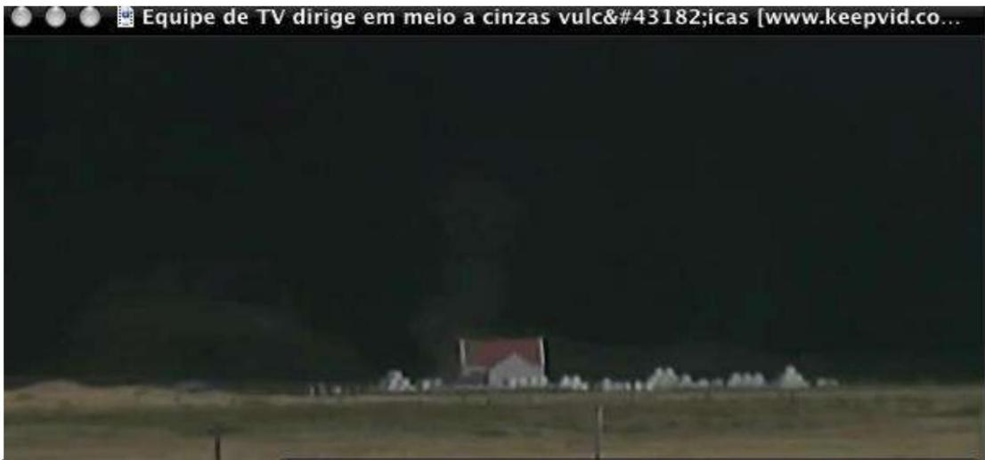
ছবি 2 - দিগন্ত জুড়ে ছড়িয়ে পড়া আইসল্যান্ডীয় আগ্নেয়গিরির অগ্ন্যুৎপাত থেকে ধোঁয়া।