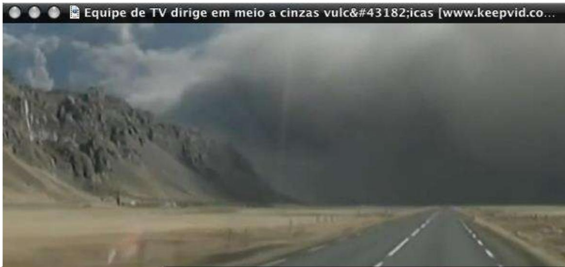
تصویر 1 - دود ناشی از فوران آتشفشان ایسلندی که در سراسر افق پخش می شود.

درجه حرارت، تمایل دارد از طریق "سوراخ" در زمین خارج شود. سیاره ما در واقع دارای "سوراخ" های زیادی است که به آنها آتشفشان می گویند -حفره هایی که گدازه های مذاب از طریق آنها با فشار زیاد خارج می شوند. پس از برخورد دنباله دار، فشار ایجاد شده توسط "مشت" به سطح زمین با انفجار بسیاری از آتشفشان ها کاهش می یابد. هر کدام از آنها هزاران تن فلز مذاب، گوگرد، زباله های سمی و دود سیاه را به آسمان پرتاب خواهند کرد که خورشید و هوا را تاریک می کند. نتایج مشابه نتایج پس از فوران تنها یک آتشفشان در ایسلند در اکتبر 2010 خواهد بود -جایی که تقریباً نیمی از پروازها در اروپا لغو شد. در نزدیکی آتشفشان نمی توانستید آسمان را ببینید، زیرا دود همه چیز را سیاه کرده بود.