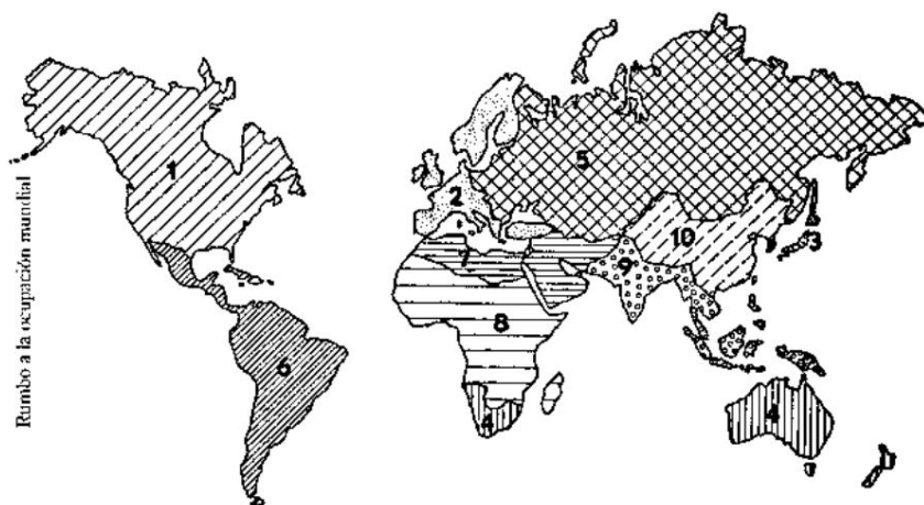
شکل - تقسیم جهان به ده پادشاهی توسط باشگاه رم (1973)

این سند نشان می دهد که باشگاه جهان را به ده منطقه سیاسی/اقتصادی تقسیم کرده است که آنها را "پادشاهی" می نامد. منبع: Rumbo a La Ocupación Mundial صفحات 60، 61 (تاکید و تاکید اضافه شده) منتشر شده در Oitavo، فصل 7. - ویرایشگر 4 Anjos.