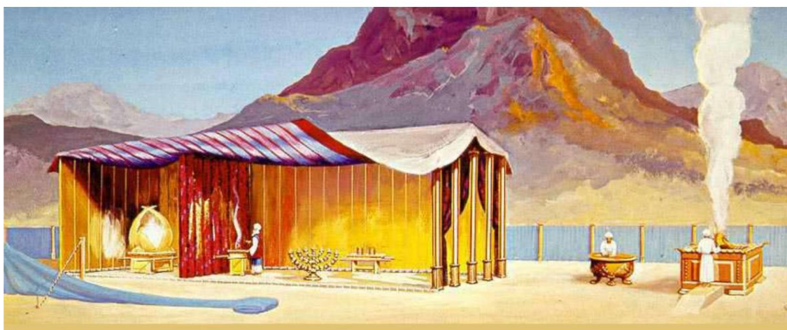
Рисунок – Святое (справа, где находится священник) и самое святое (слева) места.

Бог повелел Моисею построить святилище и поставить внутри него золотой жертвенник для воскурения на нем фимиама. « Сделай жертвенник для курения... обложи его чистым золотом... и поставь жертвенник пред завесой, которая у ковчега откровения» (Исх. 30:1, 3, 6). Оба были символом, « образом и тенью небесных вещей, как и было предсказано Моисею свыше, когда он собирался построить скинию; ибо было сказано ему: смотри, сделай по образцу, который показан тебе на горе» (Евр. 8:5). Святилище евреев было копией небесного. « Ибо Христос вошел не в рукотворенное святилище, по образу истинного устроенное, но в самое небо». Христос « сидит на небе одесную престола величия » и там « служитель святилища и скинии истинной, которую основал Господь, а не человек» (Евр. 9:24; 8:1). , 2). Святилище было разделено на две части, разделенные завесой: « ибо приготовлен шатер... в котором светильник, и стол, и хлебы предложения; это называется святым местом; а за второй завесой был скиния, называемая святая святых» (Евр. 9:2, 3).