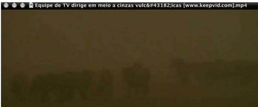
Изображение 3 – Изображение сделано днем – видимость затруднена из-за дыма от вулкана.

Из изображений выше мы имеем представление о том, как будет исполнен библейский текст. Хотя наша версия Библии дает нам понять, что звезды не будут светить в течение третьей части дня и ночи, другие версии дают нам понимание того, что на самом деле произойдет поражение третьей части Земли. тьмой, но не звездами. Тогда небеса почернеют и яркость звезд потускнеет. В Апокалипсисе комментируется эффект тьмы, вызванной дымом на земле – звезд не будет видно. Иерусалимская Библия, например, дает нам такой текст: « третья часть их (звезд) потускнела; день потерял треть своего света, как и ночь» (Откр. 8:12). Поэтому мы понимаем, что это пророчество может исполниться следующим образом: небо на трети земли будет почернеть от дыма вулканов. Не нужно быть учёным, чтобы предсказать последствия. Без света растения не могут развиваться. Таким образом, будут потеряны целые урожаи, что усугубит проблему голода, который возникнет после исполнения первой трубы. Слова Иисуса исполнятся буквально: « Будут глады, моры и землетрясения по местам» (Мф. 24:7).