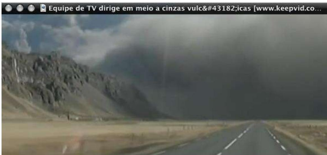
Изображение 1 – дым от извержения исландского вулкана распространяется по горизонту.

температуры, он будет стремиться выйти через « дыры» в земле. Наша планета на самом деле имеет множество « дыр», называемых вулканами – дыр, через которые под высоким давлением выходит расплавленная лава. После падения кометы давление, создаваемое « ударом», который она нанесет на земную поверхность, будет снято взрывами многих вулканов. Каждый из них выбросит в небо тысячи тонн расплавленных металлов, серы, токсичных отходов и черного дыма, затемняющего солнце и воздух. Результаты будут аналогичны тем, которые наблюдались после извержения всего лишь одного вулкана в Исландии в октябре 2010 года, когда почти половина рейсов в Европу была отменена. Возле вулкана неба не было видно, так как все заволочло дымом.